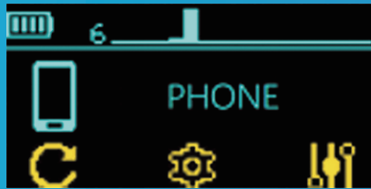
Cep telefonu tespit edildi